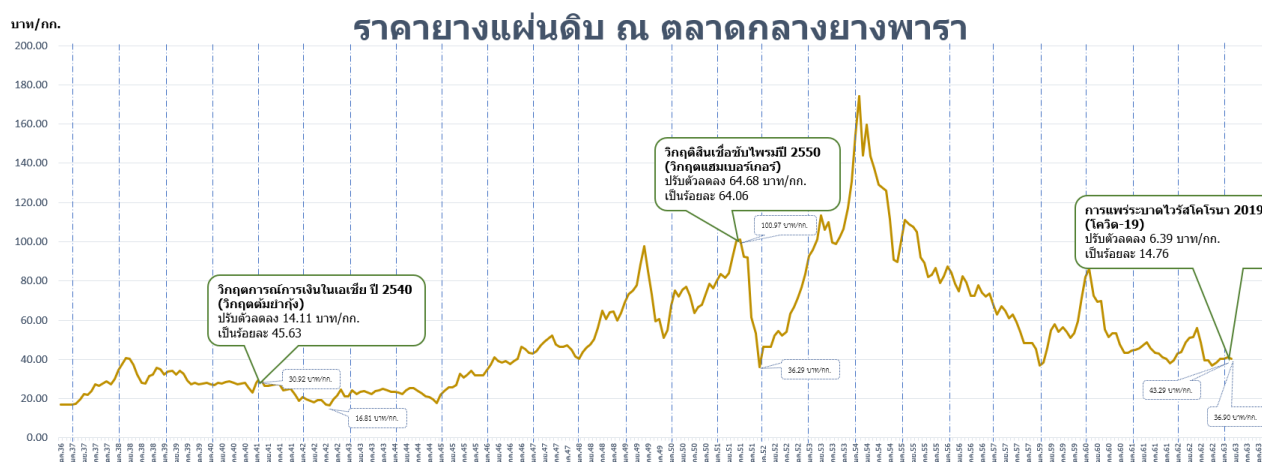
ภาพที่ 2 กราฟเปรียบเทียบราคารายางแผ่นรมควันชั้น 3 และตลาดล่วงหน้าต่างประเทศ

3. ผลกระทบจากการแพร่ระบาดของไวรัสโคโรนา (โควิด-19) เมื่อเทียบกับวิกฤตการณ์การเงินในเอเชียปี 2540 (วิกฤตต้มยำกุ้ง) โดยราคายางแผ่นดิบก่อนเกิดวิกฤตอยู่ที่ระดับ 30.92 บาท/กก. ปรับตัวลดลง 14.11 บาท/กก. เป็นร้อยละ 45.63 ส่วนช่วงวิกฤตสินเชื่อบีบไซม์ปี 2550 (วิกฤตแฮมเบอร์เกอร์) ก่อนเกิดวิกฤตอยู่ที่ระดับ 100.97 บาท/กก. ปรับตัวลดลง 64.68 บาท/กก. เป็นร้อยละ 64.06 และการแพร่ระบาดของไวรัสโคโรนา 2019 (โควิด-19) ก่อนเกิดวิกฤตอยู่ที่ระดับ 43.29 บาท/กก. ปรับตัวลดลง 6.39 บาท/กก. เป็นร้อยละ 14.76 จากสถานการณ์การแพร่ระบาดของไวรัสโควิด-19 ทำให้เศรษฐกิจโลกโดยภาพรวมชะลอตัวลง โดยดัชนี PMI ภาคการผลิต ของประเทศคู่ค้ามีโอกาสฟื้นตัวในจีน เนื่องจากสามารถควบคุมการแพร่ระบาดโควิด-19 ได้ ในขณะที่สถานการณ์ในหลายประเทศทั่วโลกยังคงอยู่ในสถานการณ์เฝ้าระวัง โดยเฉพาะ สหรัฐฯ ซึ่งจากการคาดการณ์ ดัชนี PMI ภาคการผลิต เศรษฐกิจจีน มีโอกาสเหนือกว่าระดับ 50 บ่งชี้ว่า เศรษฐกิจฟื้นตัวจากไตรมาสก่อน อยู่ที่ร้อยละ 50.00 – 52.00 แต่เศรษฐกิจสหรัฐฯ, ญี่ปุ่น และยุโรปโซน ภาคการผลิตอาจอยู่ในสภาวะหดตัวต่ำกว่าระดับ 50 อยู่ที่ร้อยละ 30.00 – 49.50 เนื่องจากยังไม่สามารถหาแนวทางป้องกันการแพร่ระบาดของไวรัสโควิด-19 ได้ และการปิดโรงงานผลิตชิ้นส่วนรถยนต์ ได้แก่ โตโยต้า ฮอนด้า ฯลฯ จากหลายภูมิภาคทั่วโลกที่ปรับลดกำลังการผลิตให้สอดคล้องกับอุปสงค์ แต่จะกลับมาเปิดโรงงานอีกครั้งช่วงปลายเดือนเมษายนนี้